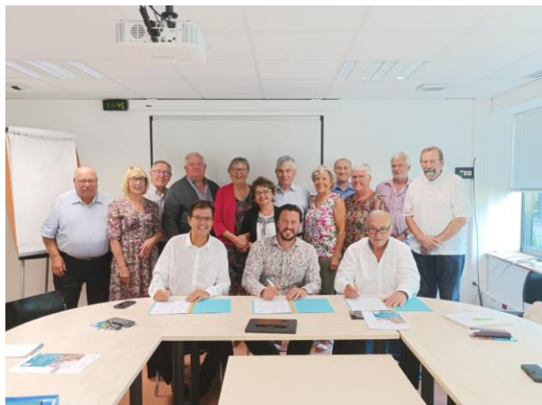
Signature de la convention de partenariat lors d'un CA exceptionnel tenu dans les locaux de la Maison de la Charente-Maritime